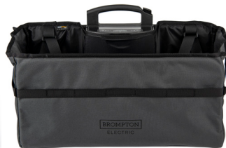
E Basket (opcional) NUEVA