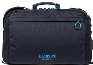
City Bag (opcional) 20 litro